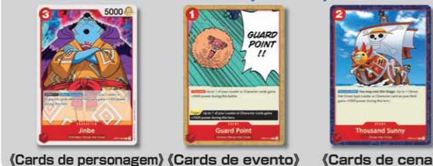
(Cards de personagem) (Cards de evento) (Cards de cena)

Os decks são formados por 3 tipos de cards: